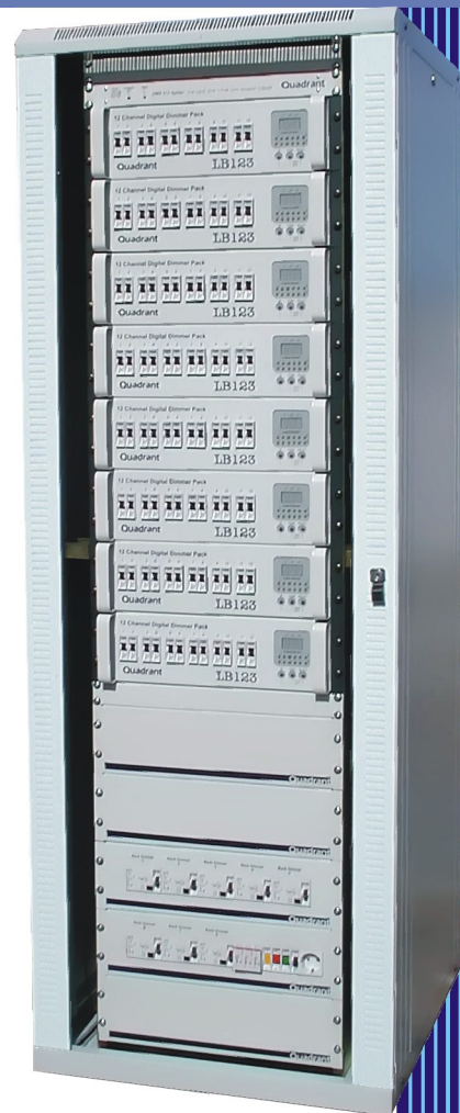
Unidades de Gaveta

Made by: Leid Ida . Rua do Município, 9 - 7490-243 MORA Telf.:+351.266 403 597 Fax.:+351.266 403 461 www.leid-portugal.com e.mail: produto@leid-portugal.com